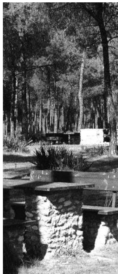
Equipamientos para el uso público en la comarca de Doñana.

pesar de constituir la columna vertebral del proyecto de WWF/Adena. Tras la necesaria adaptación del proyecto a las demandas locales y un año de funcionamiento del proyecto, se puede afirmar que la primera fase se encuentra en un